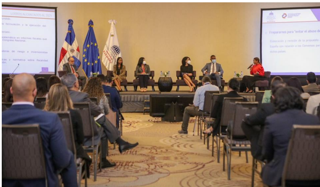
Presentación de en el evento “Avances en la implementación del Plan de Acción de Fortalecimiento de la Gestión de las Finanzas en República Dominicana (2020-2022)”

jueves 9 de diciembre 2021 en el Hotel Sheraton. La actividad tenía como objetivo principal que cada entidad beneficiaria del PROGEF compartiera los principales logros obtenidos durante el año 2021 en la implementación del Plan de Acción. La Institución mostró las proyecciones de las metas previstas para el año 2022 en torno al programa.