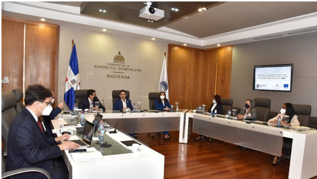
Acto de socialización de los lineamientos base para el monitoreo y seguimiento a las acciones del Plan de Acción del PROGEF 2020-2022 en el Ministerio de Hacienda

Participación en el acto de socialización de los lineamientos base para el monitoreo y seguimiento a las acciones del Plan de Acción del PROGEF 2020-2022 y el instrumento mediante el cual se realizará el reporte de los avances (Ficha de monitoreo). La actividad se desarrolló el miércoles 30 de junio 2021 en el Ministerio de Hacienda.