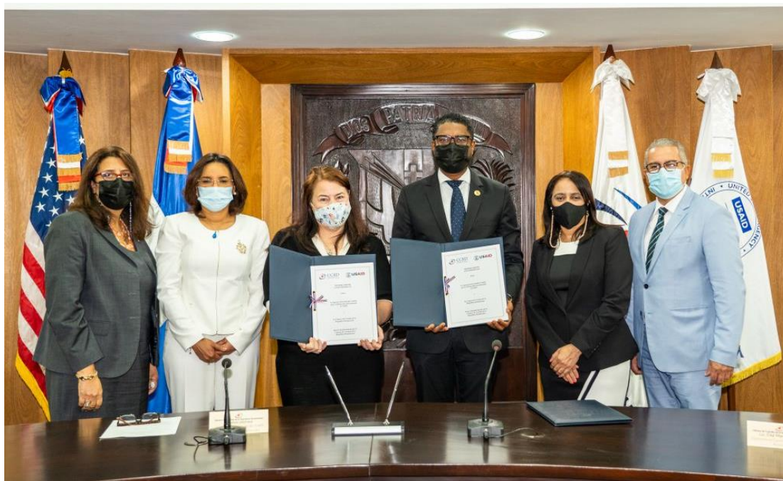
Firma del Memorando de Entendimiento entre la Agencia de los Estados Unidos para el Desarrollo Internacional (USAID) y la Cámara de Cuentas de la República (CCRD)

Memorándum la USAID y la Cámara de Cuentas tienen el propósito abordar las necesidades de entrenamiento y capacitación de la Institución.