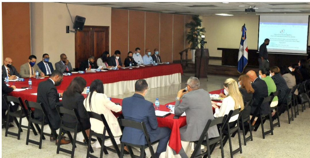
Primera reunión de coordinación con los órganos rectores y entidades que intervienen en el Estado de Recaudación e Inversión de las Rentes (ERIR), realizada el miércoles 27 de octubre 2021.

Se realizaron propuestas de los actores involucrados y se acordaron compromisos, incluyendo la realización de reuniones interinstitucionales para coordinar aspectos de diferencias de registros y fechas de entregables para cumplir con los mandatos establecidos en la Constitución y las leyes.